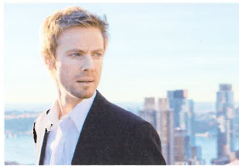
アンドリュー・フォン・オーエン