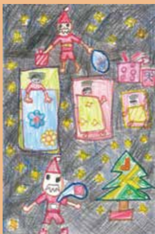
259 柴田 桃瑚 / 8才