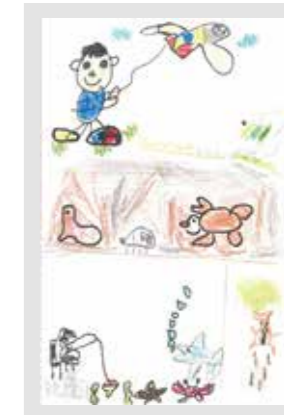
340 石津 俊弥 / 7才

土の中にも海の中にもたくさんの生きものたち。小さなポストカードにおさまりきらないような広い世界にわくわくします。こまかいところまでとても丁寧ですね。 (岡本麻美/山口県立美術館学芸員)