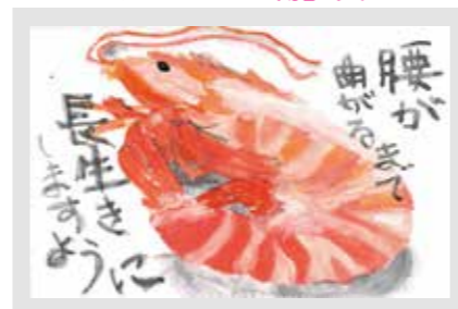
462 秋山 未樹

ユーモアの要素が、意味ある視点から交えられていて、とても美しく描かれたはがきである。 (ミクストメディアアーティスト/ジュリアン・グロスマン)