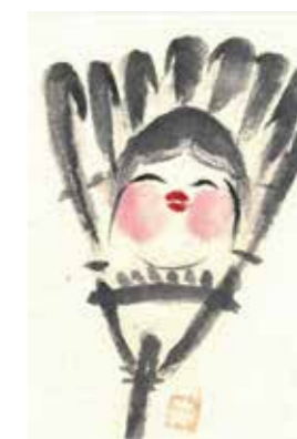
232 山下 靖子 / 86才

見れば見るほど、幸せそうな顔や赤いほっぺた、伝統的な花柄など、様々な要素に気がつくのでこの作品を選んだ。すべてがとても幸せそうに感じられる。こんなはがきをフィンランドの自分の家族にも送りたい。