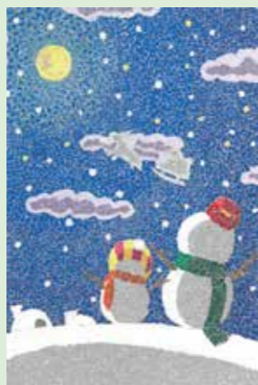
337 福永 佳奈 / 18才