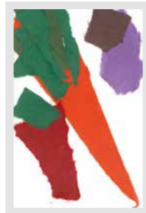
74 三好 葵 / 2才

だいたんに色面で野菜を構成し、力強さ、生命力を感じた。美味しそうに見えないと食欲もわかない。しっかり食べて、体も心も大きくなってください (片山善則/下関市立内日中学校教頭)