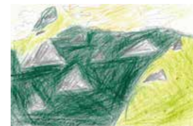
389 山縣 和 / 11才

このはがきはシンプルで単純な素材だけでできているけれど、とても印象が強い。風が太陽(日の入り?)に吹くのを感じることが出来る、作者の故郷と人生との関連性がよくうかがえる。すばらしい! (アーティスト/リウ・チーホン)