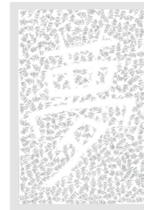
200 日山 優奈 / 13才

他の作品が描く事に焦点を置いているのに対し、この作品は「夢」という概念を消す(又はホワイトで描く)行為を通じて表現した。画面はたくさんの「夢」という文字で埋め尽くされており、作者はその文字を上から消して、もう一つの「夢」という文字を書いた。この「消す」という行為が実に面白い。 (アーティスト/チャ・ヘリム & 通訳・写真家/ジェイソン・ファン)