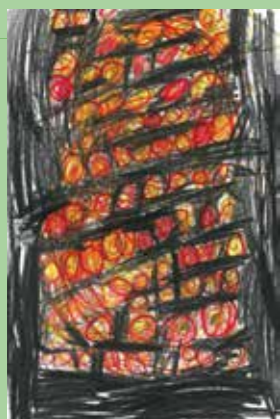
283 山本 琉太郎 / 8才