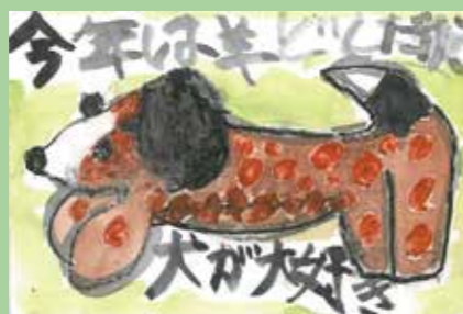
361 深川 興己 / 8才