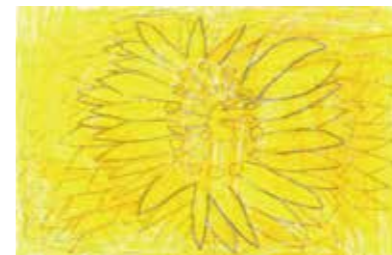
212 阿武 芹 / 6才

シンプルな色づかいと花びらの開く勢いがあり、力強い作品になっています。何枚の花びらが描かれているのでしょうか。一枚一枚丁寧に描かれていて、気持ちのよい絵に仕上がっています。またがんばって描いて下さい。 (河野令二/山口大学教育学部教授)