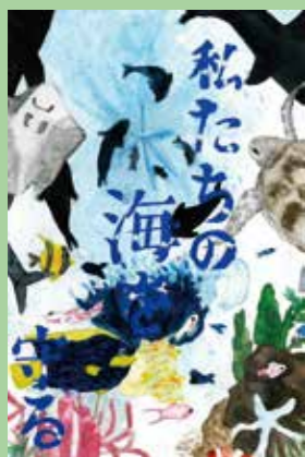
319 畑辺 夏季 / 14才