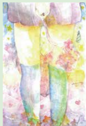
511 宮本 光里 / 14才