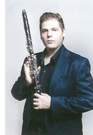
コハーン・イシュトヴァーン