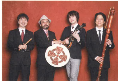
栗コーダーカルテット