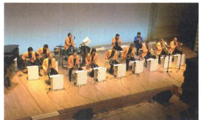
アートフェスティバル