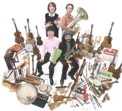
栗コーダーカルテット