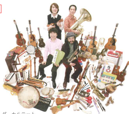
栗コーダーカルテット

FN 先行発売 9/28(土) 10:00~ 一般発売 10/1(火) 10:00~