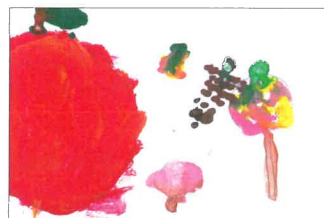
昨年度ポスコン賞