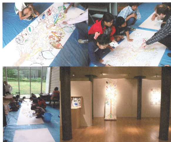
ワークショップ、展示会の様子