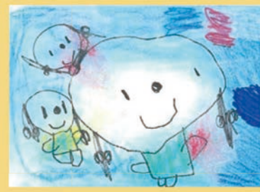
213 久保田 麻友 3歳