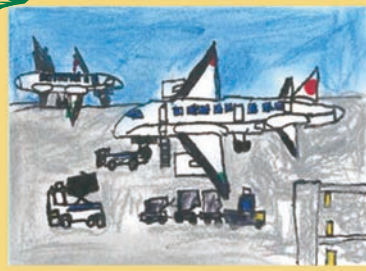
201 津森 隆甫 5歳