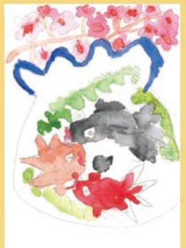
461 大谷 日向璃 6歳