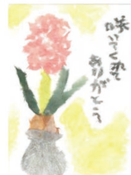
15 山口 愛子 62歳