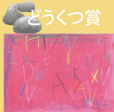
297 田辺 優羽 5歳