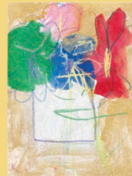
311 田辺 優羽 5歳