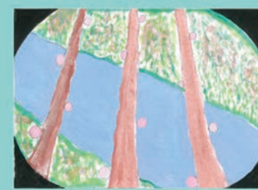
359 中谷 哲也 中3