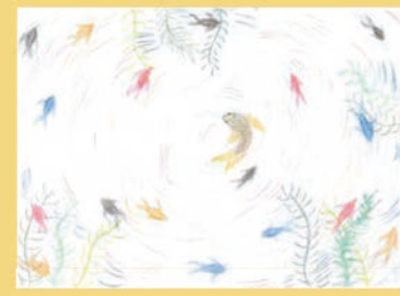
308 マーキュリース 明優美 9歳