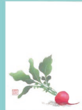
190 縄田 道代 79歳