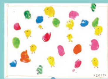
288 谷 紗代・蒼佑 27歳・1歳