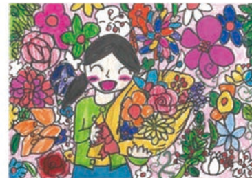
63 岩坂 渚 9歳