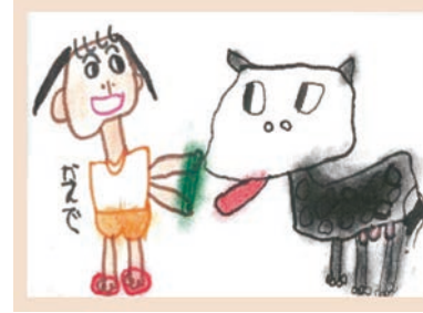
365 宇都宮 楓 5歳

牛にえさをあげるシーンをシンプルにとらえています。なにに気ない場面ですが、長い舌におどろき、少し身を引いている仕草から作者の感動体験が伝わってきました。