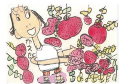
364 宇都宮 楓 5歳