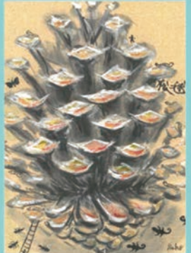
453 山本 さほ 42歳