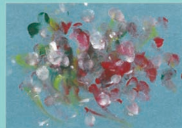
106 野村 周平 30歳