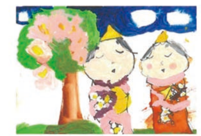
510 福田 結月 6歳

青空の舌に優しい桃色で咲く花。寄りそうおだいりさまとおひなさまがとても幸せそう。着物の細かいところもよく描けていて見ていると優しい気持ちになる作品です。