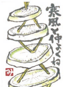
295 古川 ミサコ 75歳