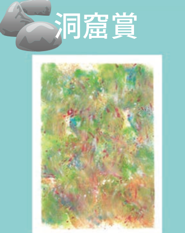
44 嶋田 浩伸 21歳