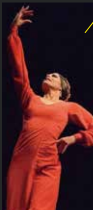
ルシア・ルイバル Lucia Ruibal /フラメンコ

スペインはカディスの音楽一家の元に生まれ、グラミー賞ノミネート経験のあるフラメンコ・ジャズピアニストの父チャノ・ドミンゲスの影響により若い時からフラメンコとジャズに精通していた。初めはパーカッションを勉強し、その後ギターを学ぶ。21歳の時ロンドンに渡り、そこではフラメンコに携わりロニー・スコットの有名な会場でレジデンス・ギタリストを務めた。フィラデルフィアのボーカルグループ「ザ・ターバンズ」などと共演。