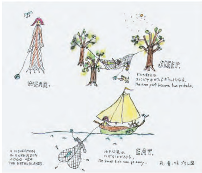
Drawing : a fisherman 2000