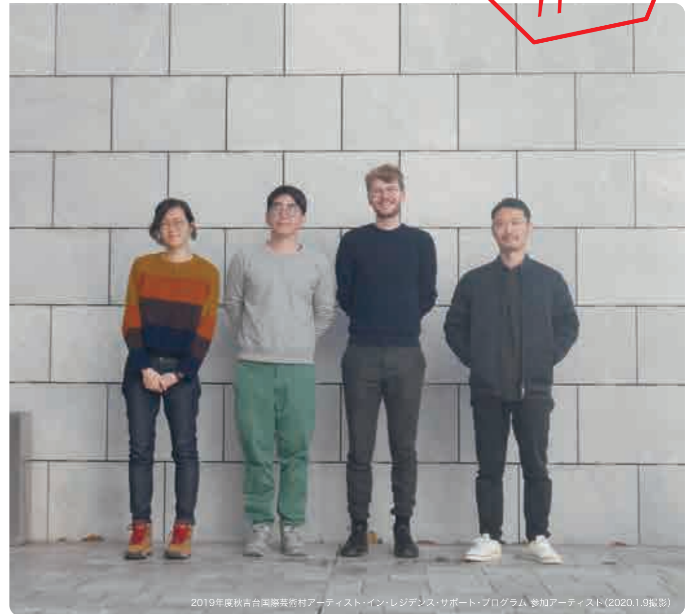
2019年度秋吉台国際芸術村アーティスト・イン・レジデンス・サポート・プログラム 参加アーティスト(2020.1.9撮影)

展覧会「Re:trans_2019-2020〜この土地とともに生きる〜」2021.2.14 (sun)-2.23 (tue)