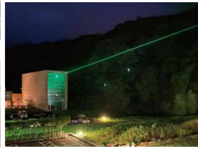
▲宿泊棟レストランより発射されるレーザー(三輪 和彦[十三代三輪休雪]「Laser」)。メインとなる「ベルセポリス」では、重要な照明演出の一つとなった。