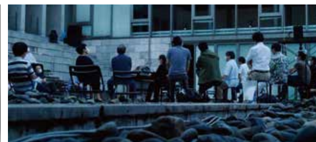
▲演奏者(中央)を取り囲むように客席が設けられ、周囲には8方向16台のスピーカーが設置された。