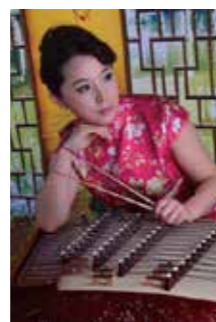
シー・ウェン(揚琴)

中国の民族楽器の中で代表的な弦楽器。日本では一般に胡弓という呼び名で親しまれている。その他、京劇で使われる京胡のほか、高胡、中胡、板胡などの種類があり、これらを総じて胡琴という。二胡は、筒状の共鳴胴の表に蛇皮が張られており、弦は二本。馬の尻尾が張られた弓で弦を擦って音を出す。