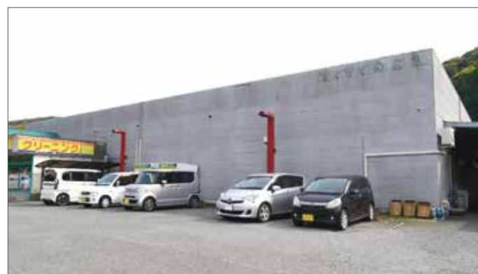
壁画プロジェクトが進行中の「サイサイみとう」外壁

日時 10/2(日) ■作品展/9:30~19:30 ■完成披露会/14:00~ 会場 ショッピングセンターサイサイみとう(美祿市美東町大田5439-1) ※「道の駅みとう」の駐車場もご利用いただけます 制作 山口県内の大学生有志のみなさま 制作指導 スクリチュ・アグニェシカ(2022年度フェロシッププログラム参加アーティスト) 協力 ショッピングセンターサイサイみとう ※完成披露会(屋外開催)は雨天中止。