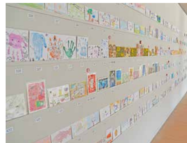
昨年の展覧会の様子

募集期間 11/1(火)-30(水) 必着 参加無料 応募方法 作品の裏に、住所・氏名(希望者はペンネームを併記)・ふりがな・年齢・電話番号またはEメールアドレスを記入の上、芸術村まで郵送またはご持参ください。個人応募は1人3作品まで、団体応募は1人1作品まで応募できます。 展示期間 2023年1月8日(日)~2月5日(日) 表彰式 2023年1月8日(日)14:00~(予定)