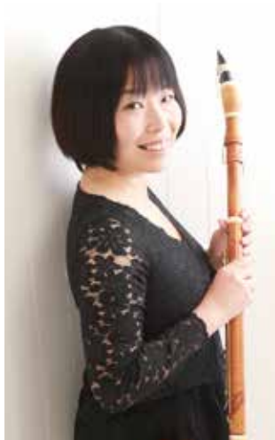
クラリネット 満江 菜穂子 Nahoko Mitsue

ヒストリカルオーボエの第一人者。ソリストとしてカーネギーホール、ブラハの春音楽祭などに出演。アンサンブル「ラ・フォンテーヌ」のメンバーとして97年、古楽コンクール最高位、2000年、ブルージュ国際古楽コンクール第二位受賞。'08年より田村次男氏と共にオーボエ製作をおこなっている。ソロCD「ヴィルトゥオーソ・オーボエ」「19世紀パリのオーボエ作品集」「ヴィダーケア・デュオソナタ集」をリリース。NHK-FM「名曲リサイタル」、NHK-BS「クラシック倶楽部」等に出演。現在「パッサ・コレギウム・ジャパン」「オルケストル・アヴァン＝ギャルド」首席オーボエ奏者。「アンサンブル・ヴィンセント」主宰。東京藝術大学古楽科講師。