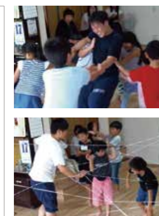
過去のワークショップの様子