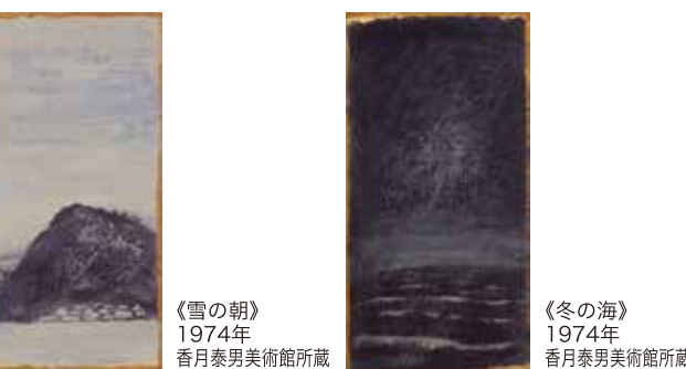
《雪の朝》1974年 香月泰男美術館所蔵 《冬の海》1974年 香月泰男美術館所蔵