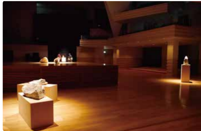
▲ホール展示例 2017年度採択事業より