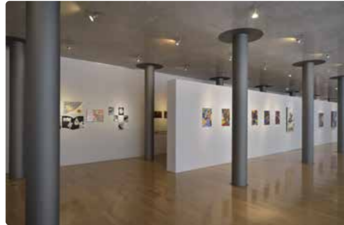
▲ギャラリー展示例 2016年度採択事業より

お部屋にはバス・トイレ・テレビ・冷蔵庫・ポット等設置しております。※アメニティ類はご持参をお願いいたします。