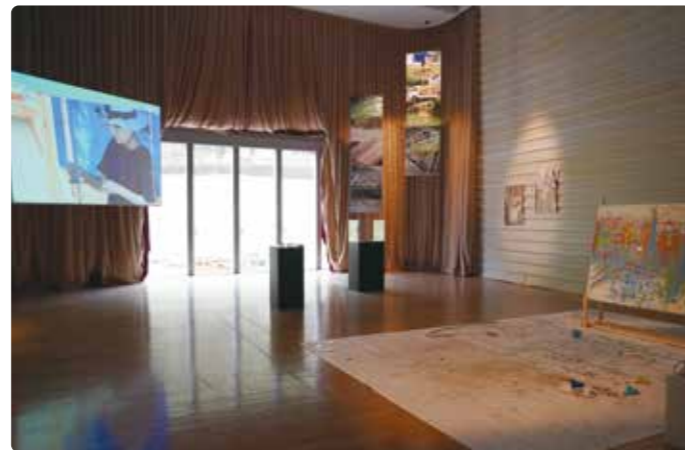
▲研修室展示例 2020年度採択事業より