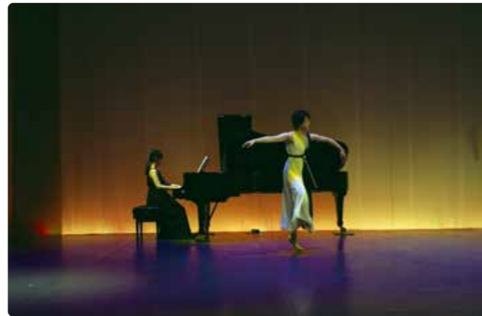
▲ホール公演例 2020年度採択事業より