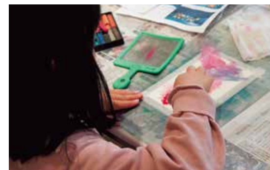
昨年のワークショップの様子