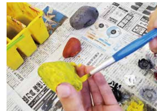
※絵の具を扱うワークショップです。汚れても良い服装でお越しください。