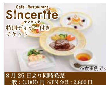
※食事例です 8月25日より同時発売 一般:3,000円 ※FN会員:2,800円