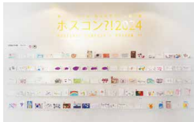
昨年の展覧会の様子

みなさんの応募作品でつくるコンテスト&展覧会「ポスコン?!」を今年も開催します。ハガキサイズの平面作品ならなんでもOK! 絵画、写真、言葉、好きなジャンルで「伝えたい!」をヒョウゲンしよう! 応募作品はすべて芸術村ギャラリーに展示されるほか、様々な賞を用意しています。