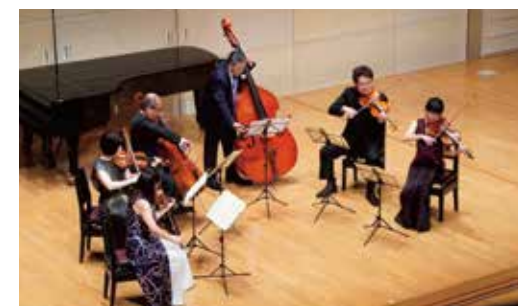
過去のコンサートの様子