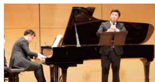
過去コンクールの様子