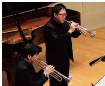
過去のコンサートの様子